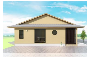
長崎県西海市T様邸 令和8年1月着工