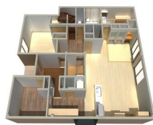
佐世保市M様邸大規模 リフォーム工事 令和8年1月着工