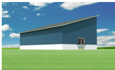
養殖施設 新築工事 令和7年12月着工