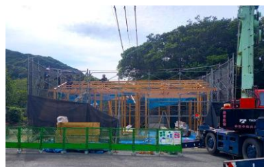
塔の尾地区消防詰所 新築工事 令和8年2月完成