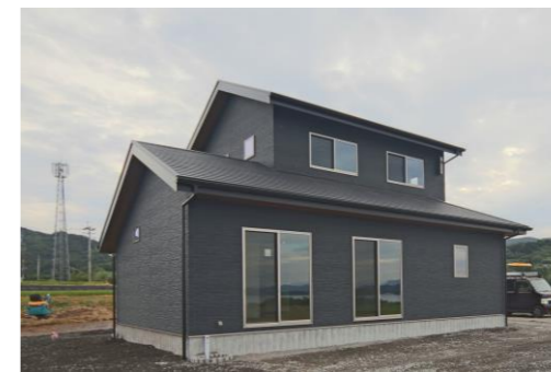
西海市西彼町K様邸 7月完成