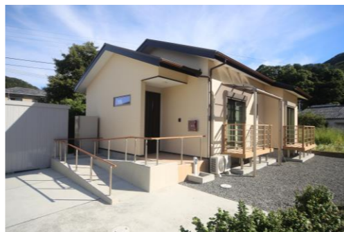
西海市大瀬戸町T様邸 9月完成