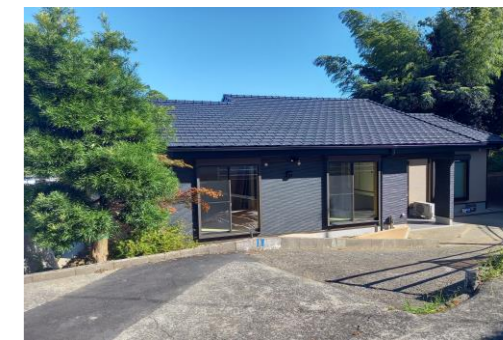
佐世保市もみの木リフォーム 8月完成