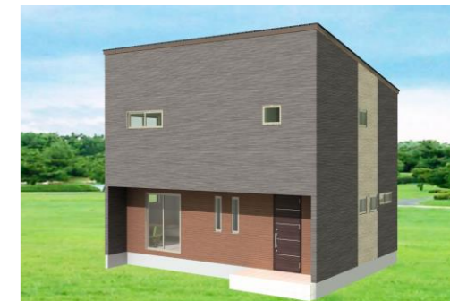
佐世保市N様邸 11月着工予定