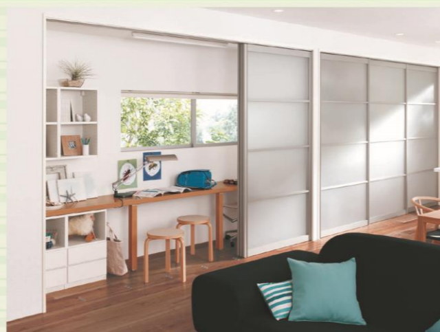
リビングの一角のワークコーナー。閉じると集中できる個室に。

▶詳しくはWEBサイトをご覧ください sumai.panasonic.jp/interior/door/screenwall/