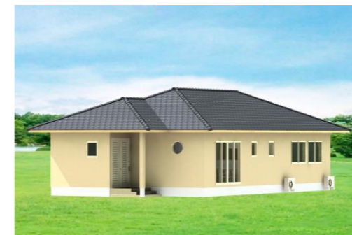
時津町左底郷N様邸 施工中