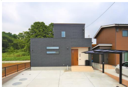
西海市もみの木の家No.24 7月完成