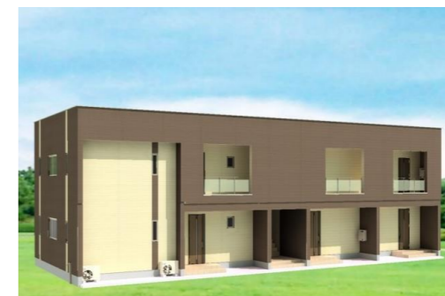
西海市西彼町コーポYUZU 10月完成