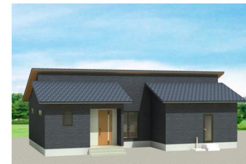
西海市もみの木の家No.25 施工中