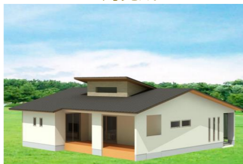
諫早市多良見町M様邸 施工中