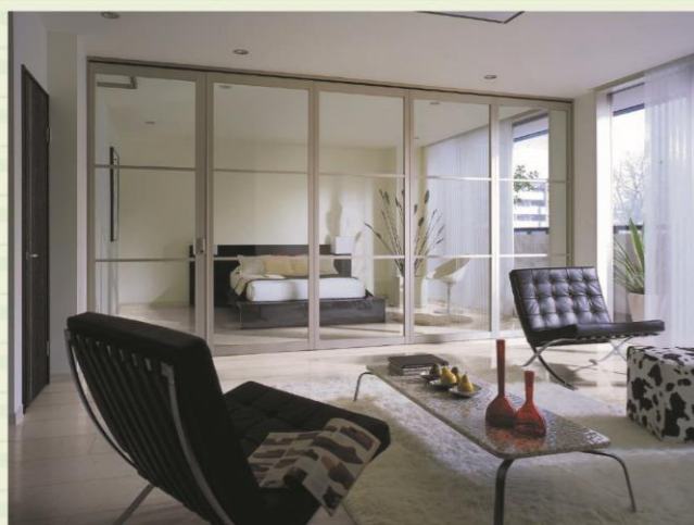
寝室とリビングを仕切りつつ、広がりのある空間に。