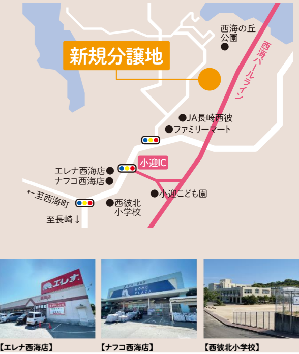
【エレナ西海店】 【ナフコ西海店】 【西彼北小学校】