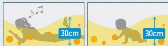
寝転んで読書する 赤ちゃんがハイハイする