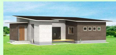
東彼杵郡川棚町 K様邸 新築工事 2月お引渡し