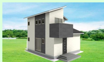
西海市大島町 I様邸 新築工事 2月お引渡し