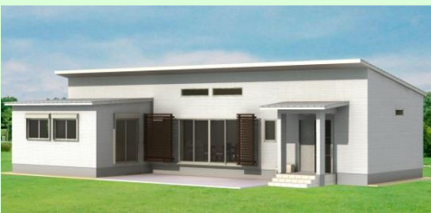
東彼杵郡川棚町 S様邸 新築工事 2月お引渡し