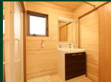
湿気の多い洗面脱衣室ももみの木でさわやかに。洗濯物も乾きます。