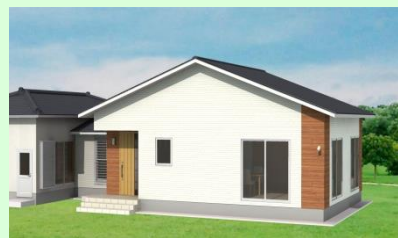
西海市西彼町 K様邸 増築工事 11月お引渡し

お客様のこだわりのお住まいを工事中です。自由設計、注文住宅ですので、お客様ごとに個性豊かなお住まいになっています。