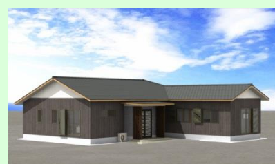
西海市西彼町 H様邸 新築工事 1月着工