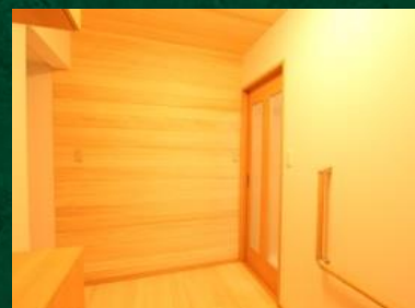
玄関ホールは家の顔。気になる靴の臭いなども消してくれます。