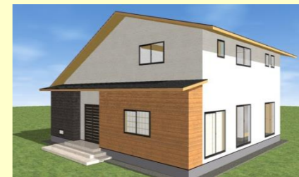
西海市大島町 N様邸 7月着工予定