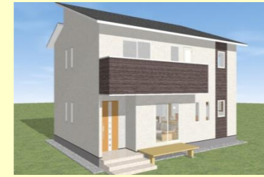
西海市西彼町 T様邸 7月着工