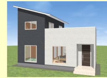
西海市大島町 N様邸 7月お引渡し 7/19(土)～20(日) 完成見学会開催