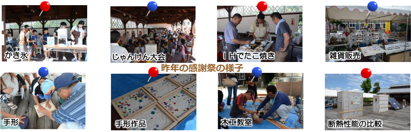
昨年の感謝祭の様子