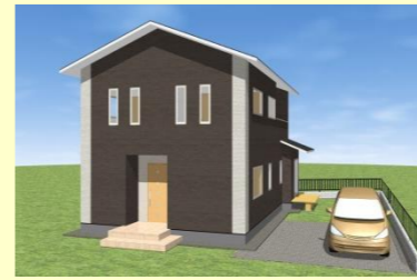
西海市西彼町 Y様邸 7月お引渡し 7/12(土)～13(日) 完成見学会開催

お客様のこだわりのお住まいが、どんどん建ってます。自由設計、注文住宅なのでお客様の個性が出ています。見学会に是非ご来場ください。