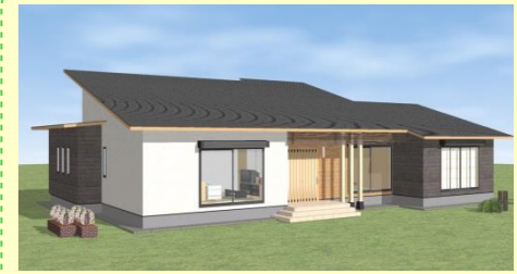
西海市西彼町 D様邸 7月着工 8/23(土)～24(日) 構造見学会開催