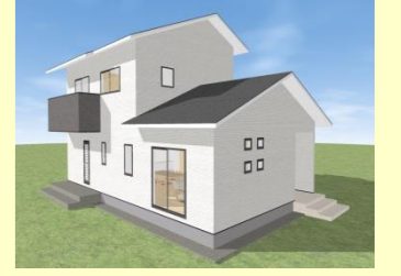
西海市西海町 T様邸 8月着工予定