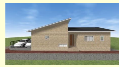
西海市大島町 K様邸 9月21～23日完成見学会