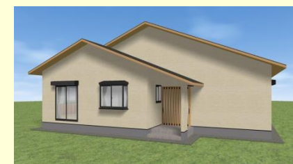
西海市西彼町 H様邸 9月14・15日完成見学会