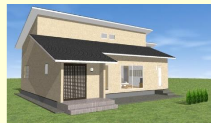
西海市西彼町 N様邸 8月お引渡し

お客様のこだわりのお住まいが、どんどん建ってます。自由設計、注文住宅なのでお客様の個性が出ています。見学会に是非ご来場ください。