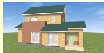
長崎市さくらの里 S様邸 10月14日構造見学会 11月16・17日完成見学会