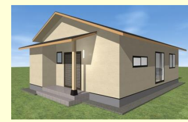
西海市西彼町 O様邸 8月上棟