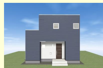
西海市西彼町 N様邸 9月完工予定