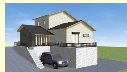
佐世保市折橋町 M様邸 8月お引渡し