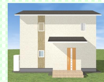
長崎市 M様邸 2月 完成見学会