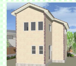
西海市 N様邸 1月 上棟予定