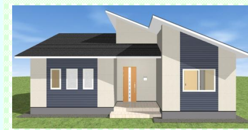
西海市 K様邸 1月 上棟予定