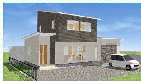
長崎市 S様邸 1月 構造見学会