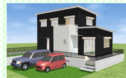
長崎市 M様邸 1月 構造見学会

着々と工事が進んでいます。 ご近所の皆様には工事中何かとご迷惑をおかけするかと思います。 最新の注意を払って工事を進めてまいりますので、ご理解の程よろしくお願い申し上げます。