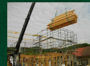
②クレーンで構造材の搬入