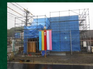
④大雨の為、吹き流しは建物前に