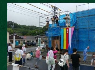
⑥餅まきの時間になると不思議と雨は上がり、無事にできました