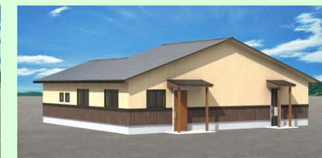
西海市大島町 M様邸 店舗新築工事