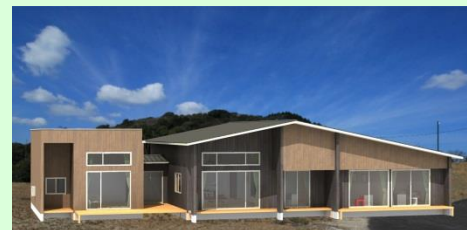
長崎市琴海尾戸町 ペニンシュラO.G.C.様 別荘D棟、C棟新築工事

お客様のこだわりのお住まいを工事中です。自由設計、注文住宅ですので、お客様ごとに個性豊かなお住まいになっています。