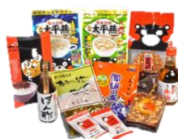
熊本うまいもん市