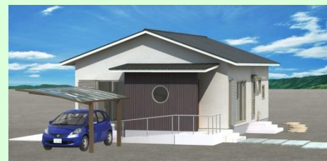
西海市西彼町 C様邸 新築工事