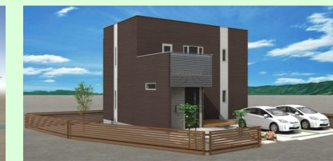
西海市西彼町 市場建築モデルハウス 新築工事 6月上棟