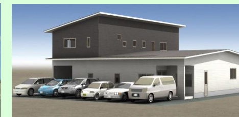
西海市大島町 S様邸 新築工事 7月上棟