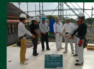
①危険予知活動(KY活動)で安全管理もしっかりと行います