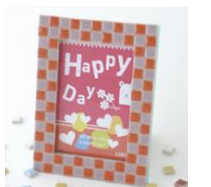
チャリティーイベント タイルdeフォトフレーム